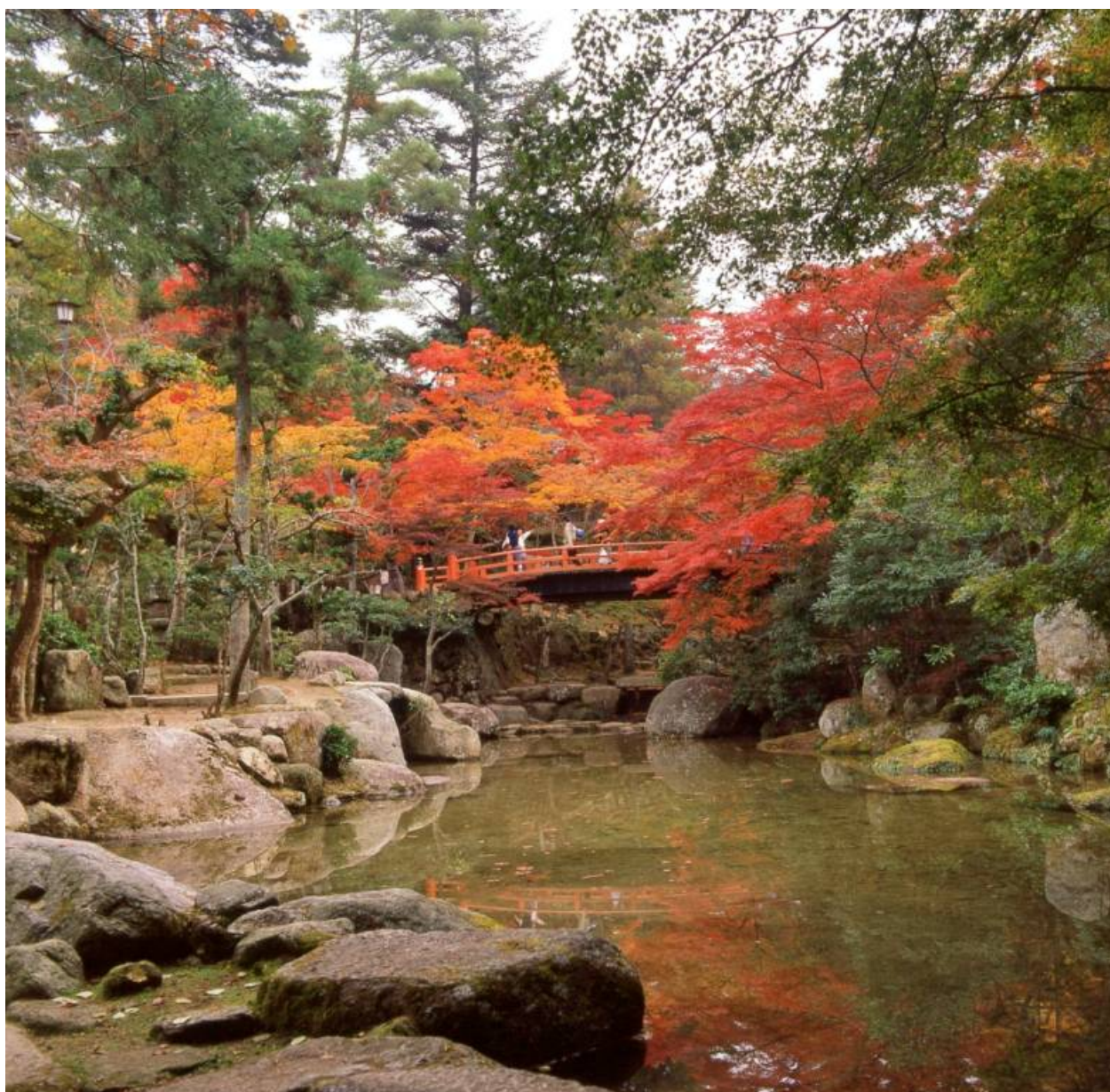
廿日市市名勝 紅葉谷公園